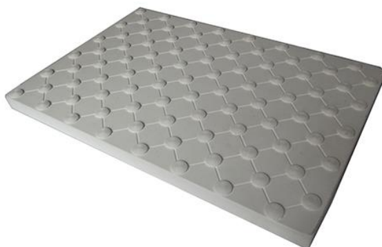
Przykład płytki z wypustkami

Betonowa płytka chodnikowa ze znakami dotykowymi, została zaprojektowana z myślą o zastosowaniu na dotykowe pasy bezpieczeństwa dla osób niewidomych i słabo widzących, poruszających się w miejscach publicznych. Ma ona szczególne zastosowanie jako bezpieczne przejścia dla pieszych na drogach, placach, chodnikach.